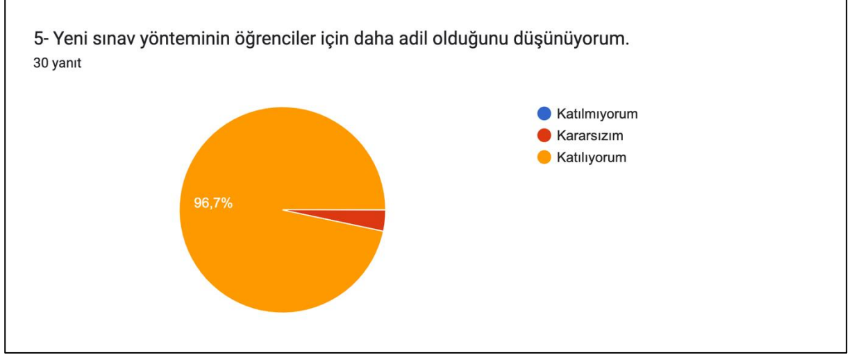
Grafik 2: Adil olmak ilkesi bağlamında yeni sınav yöntemine yönelik memnuniyet düzeyi

Adil olmak, tarafsızlık ve eşitlik ilkeleri bağlamında sınav uygulayıcılarının yeni sınav yöntemini nasıl değerlendirdiklerini ölçmek amacıyla “ Yeni sınav yönteminin öğrenciler için daha adil olduğunu düşünüyorum ” önermesi sorulmuştur.