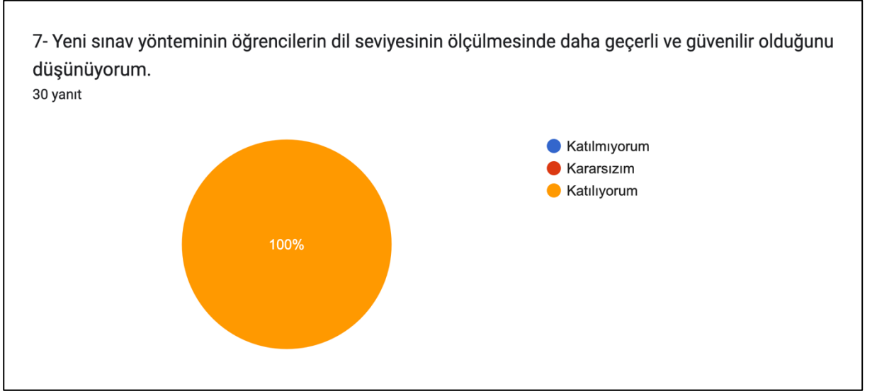
Grafik 4: Yeni sınav yönteminin yabancı dil seviyesinin ölçülmesinde daha geçerli ve güvenilir bulunması

Grafik 4'te görüldüğü üzere “ Yeni sınav yönteminin öğrencilerin dil seviyesinin ölçülmesinde daha geçerli ve güvenilir olduğunu düşünüyorum ” önermesine katılımcıların %100’ünün katıldığı tespit edilmiştir. Bulgular, katılımcıların yeni sınav yönteminin yabancı dil seviyesinin ölçülmesinde daha geçerli ve güvenilir bulunduğunu göstermektedir.