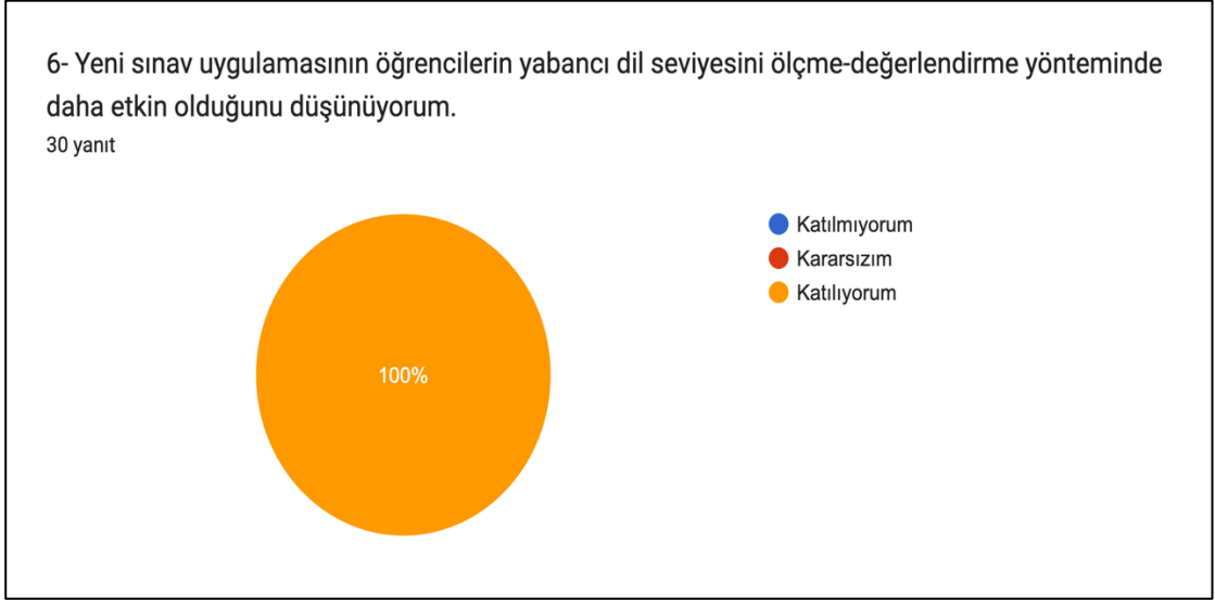
Grafik 3: Yeni sınav uygulamasının yabancı dil seviyesini ölçme-değerlendirme yönteminin etkinliğine ilişkin memnuniyet düzeyi

Grafik 3'te “ Yeni sınav yönteminin öğrencilerin dil seviyesini ölçme-değerlendirme yönteminde daha etkin olduğunu düşünüyorum ” önermesine verdikleri cevaplar sunulmuştur. Katılımcıların %100'ü önermeye katıldıklarını belirtmişlerdir. Sınav uygulayıcılarının yeni sınav yönteminin öğrencilerin dil seviyesini ölçme-değerlendirme yöntemini daha etkin buldukları ve memnuniyet düzeylerinin yüksek olduğu tespit edilmiştir.